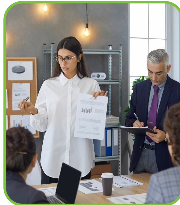
Beratung, Workshops & Begleitung

Der Social Impact Status Check hilft Ihnen dabei zu analysieren, wo Sie aktuell stehen. Darauf aufbauend bieten wir Tools, Workshops und Beratung – alles zugeschnitten auf die Praxis von Genossenschaften und Quartieren.