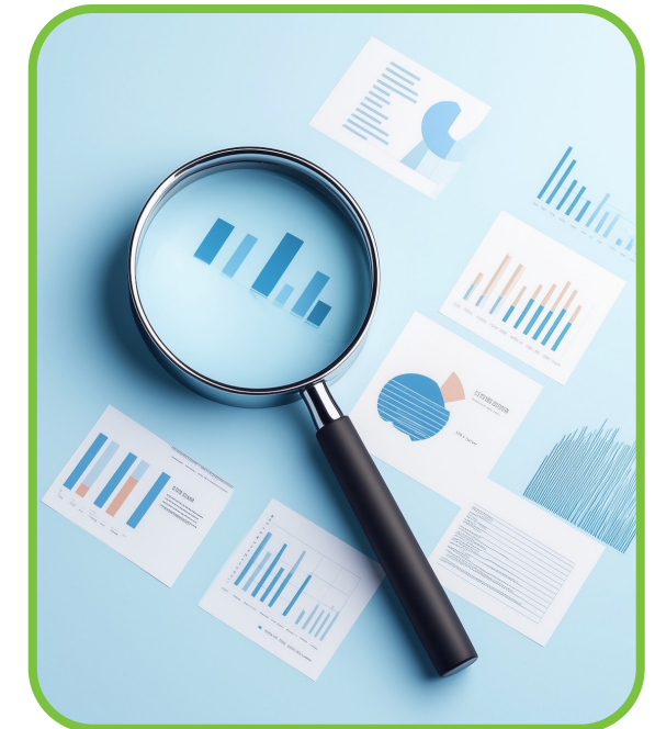
Tools zur Wirkungsmessung & Berichterstattung

Damit verabschieden wir uns bei Ihnen und hoffen, Sie haben einen guten Einblick in das Thema Berichterstattung für Wohnungsgenossenschaften erhalten.